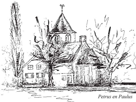
Petrus en Paulus

De Petrus en Paulus, in tufsteen, is één van de oudste kerken in Nederland. Het kerkje dateert uit de eerste helft van tiende eeuw. Kijk aan de noordzijde eens door het 'sleutelgat': het was een kijkgat voor